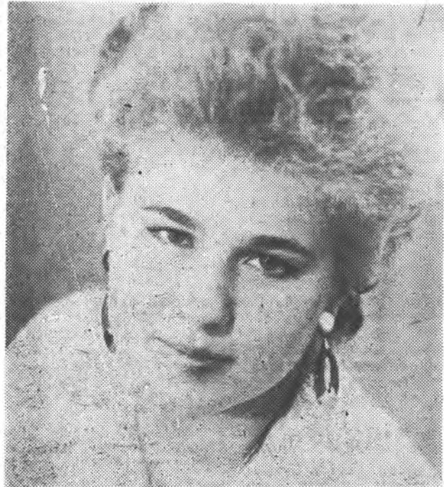
Цю дівчину на факультеті іноземних мов поважають за щире товариське вдачу, вимогливість, небайдужість до громадських справ.

Картина вимальовувалась невесела, особливо, коли до вже визначених нами двох проблем роботи КІДу додалась ще одна. Виявилось, що розшифровка аббревіатури КІД давно вже забута, навіть членами цього клубу. Отже, клуб інтер- (тобто між-) національної дружби. Натомість він перетворився (не можу сказати повністю, але відсотків на 90 — точно) на клуб внутрінаціональної дружби. Переконливим доказом цього став міжвузичний фестиваль інтернаціональної дружби «Чуття єдиної родини», на який до нас прибули гості з Ворошиловграда,